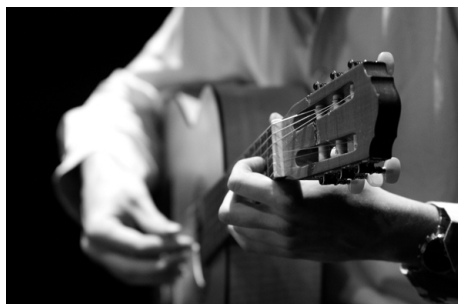
© C. Dragos, Cl. Geiger, M. Ledent